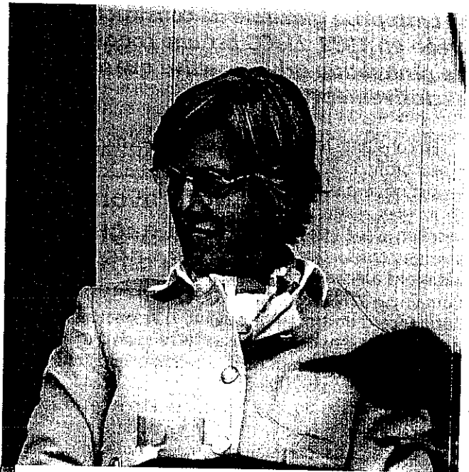
J'ai revécu le parcours de l'éveil

Tout a commencé en 1994 au moment des événements tragiques du Rwanda. J'avais vécu dans ce pays pendant quatre ans avec mon mari et mes enfants. J'y avais encore beaucoup d'amis rwandais dont j'étais sans nouvelles, j'étais